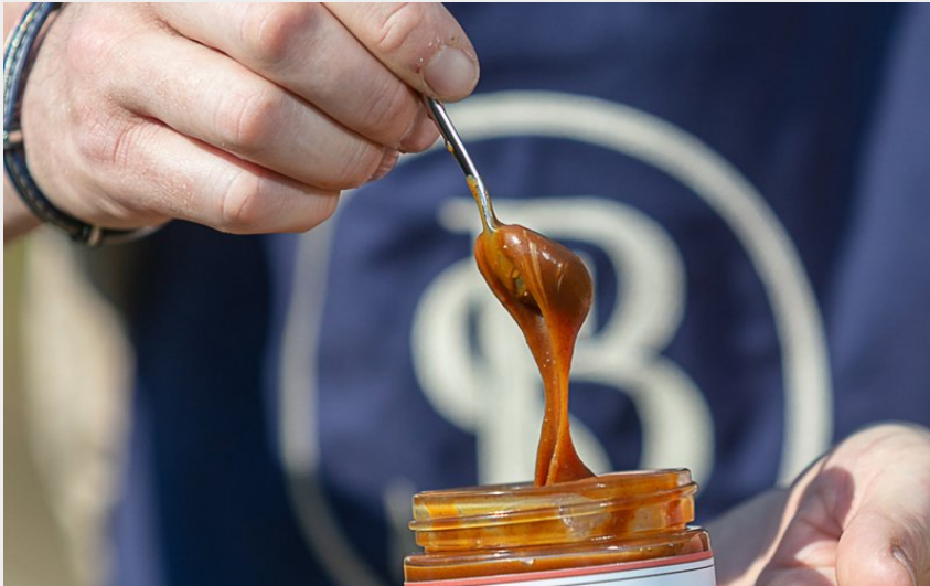
Crédit : Maison Sébastien Briault - caramel - Guérande_2 (Sébastien Briault)