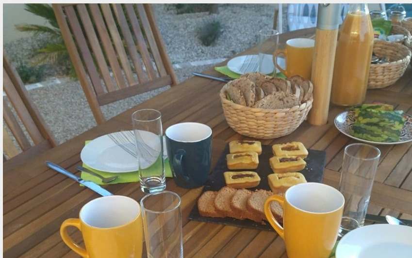
Crédit photo : Petit-déjeuner en terrasse (Les Chemins d'Ambre & Thaïs)