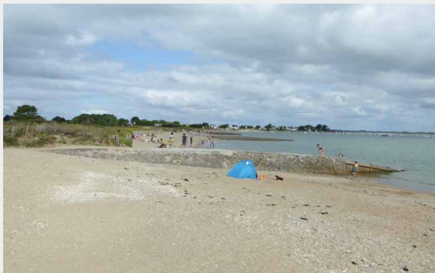
Plage des Epis - Mesquer Quimiac_1