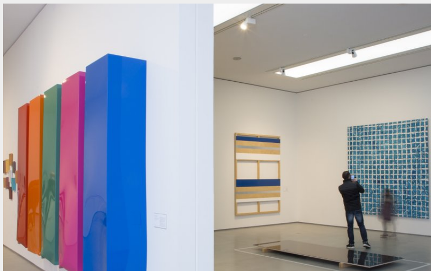
Crédit photo : Salle d'exposition du Cube (© Musée d'arts de Nantes, photo : M. Roynard)