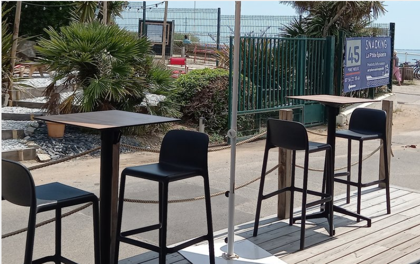
snack, vue mer, plage, restaurant rapide, 45PM, camping Port Meleu_1