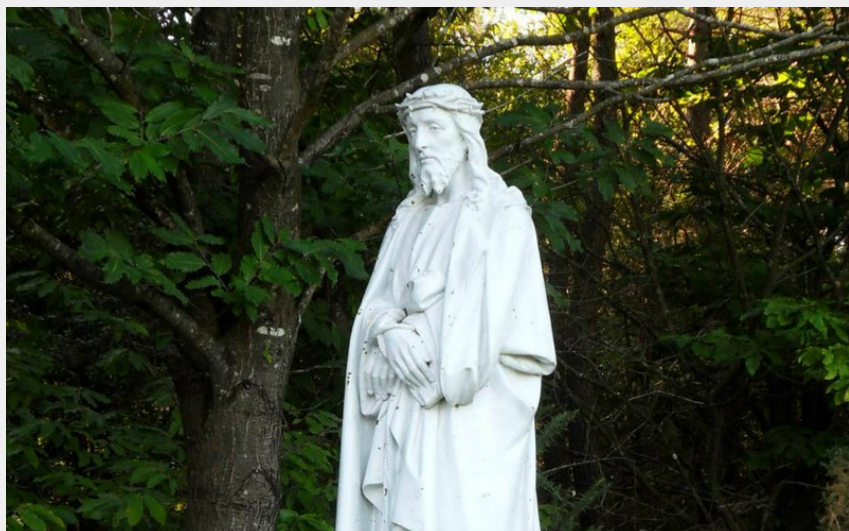
calvaire de Bernugat à Saint-Gildas-des-Bois_1