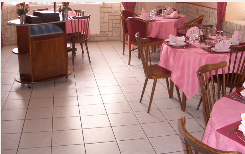
Crédit photo : restaurant-les-boisiers-blain-44-res-1 (©Jean-Jacques-Arnoux)