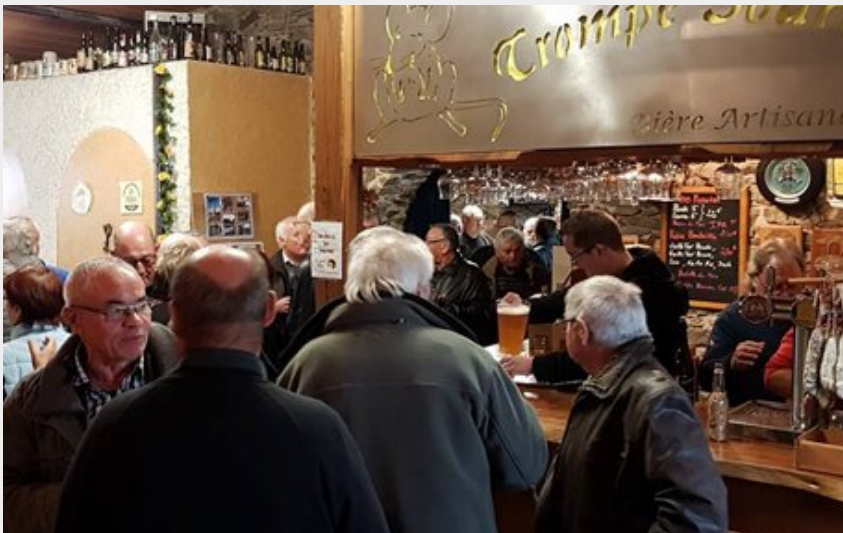
Crédit : comptoir de la salle de dégustation (Brasserie de la Divatte)