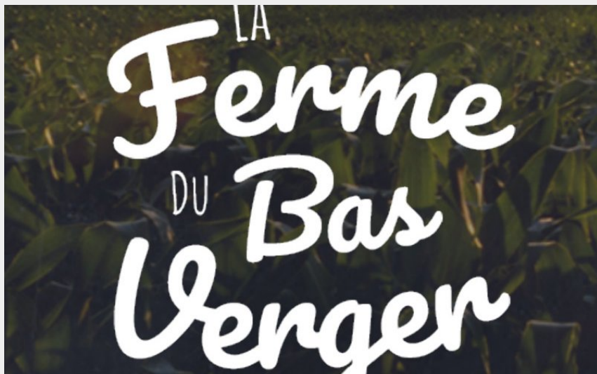
Crédit : ferme-du-bas-verger-st-mars-de-coutais-44-deg-1 (© Ferme-Bas-Verger)