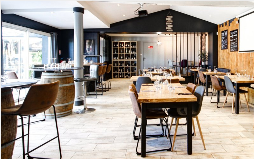
Crédit : restaurant-au-pont-divin-st-julien-de-concelles-44 (ADAMO salle de restauration)