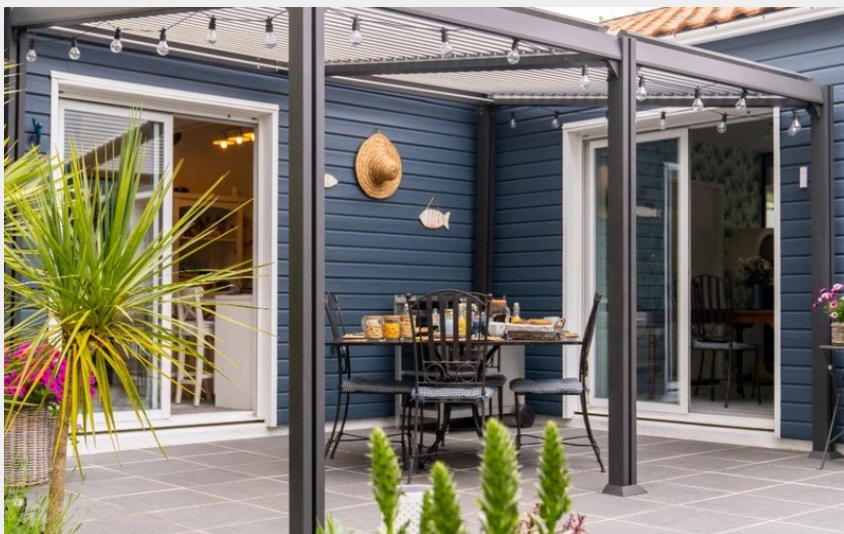
Crédit photo : 255544 - Petit déjeuner en terrasse ou l'hiver au coin du feu... (Clévacances France)