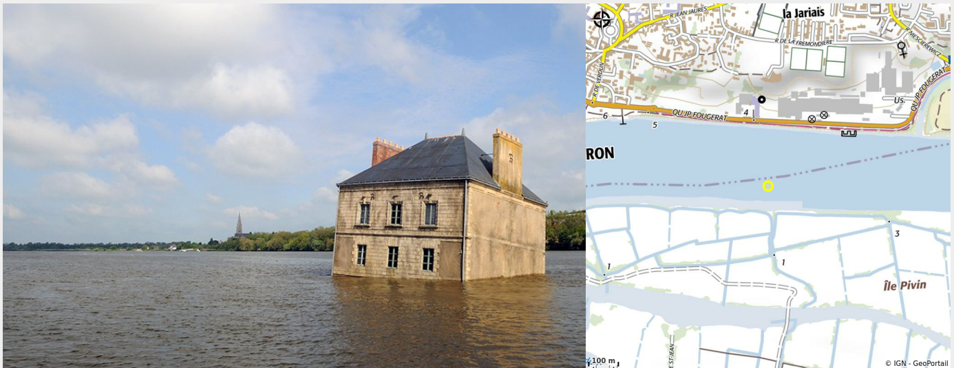
Crédit photo : (Jean-Luc Courcoult, La Maison dans la Loire, Couëron, création pérenne Estuaire 2007 © Bernard Renoux/LVAN)