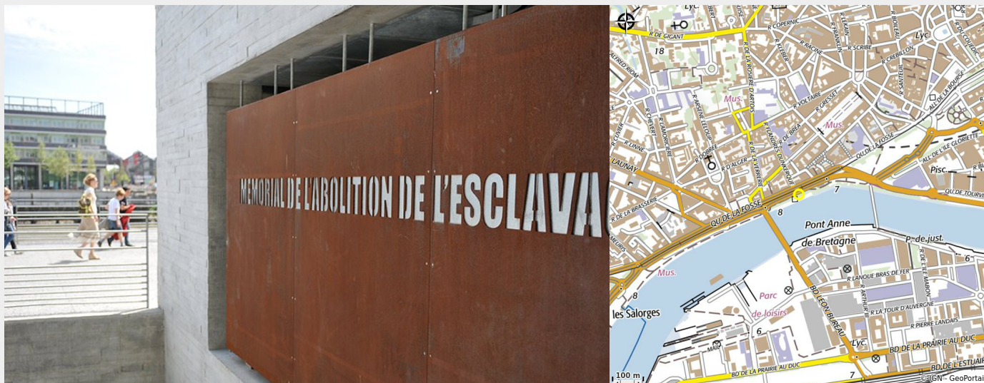
Parcours méditatif. Le Mémorial de l'abolition de l'esclavage. Nantes