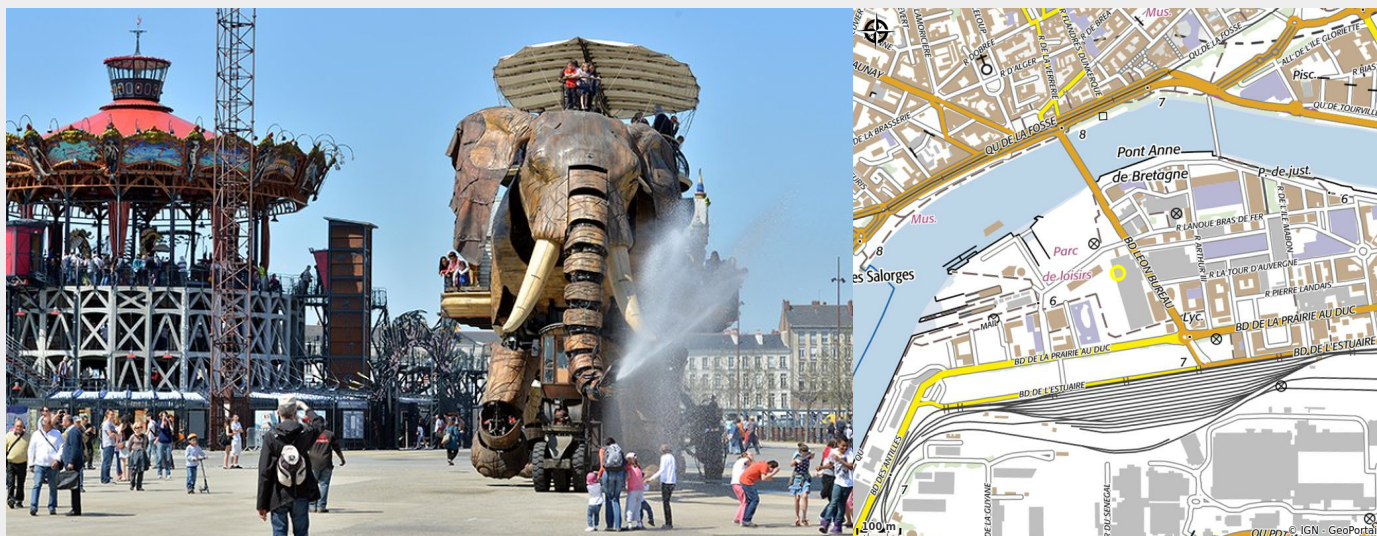
Crédit photo : (Les Machines de l'île. Nantes © Jean-Dominique Billaud - Nautilus/LVAN)

Les Machines de l'île est un projet artistique totalement inédit.