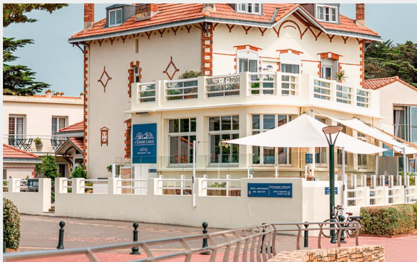
Le Grand Large - Restaurant La Bernerie en Retz_1