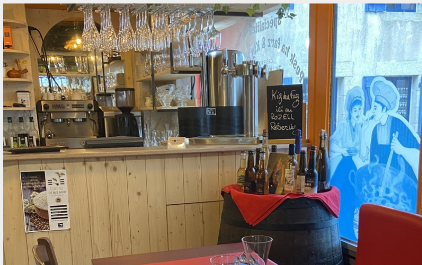
Crédit photo : Le Rozell Crêperie table bretonne - Piriac sur Mer_1 (Le Rozell)