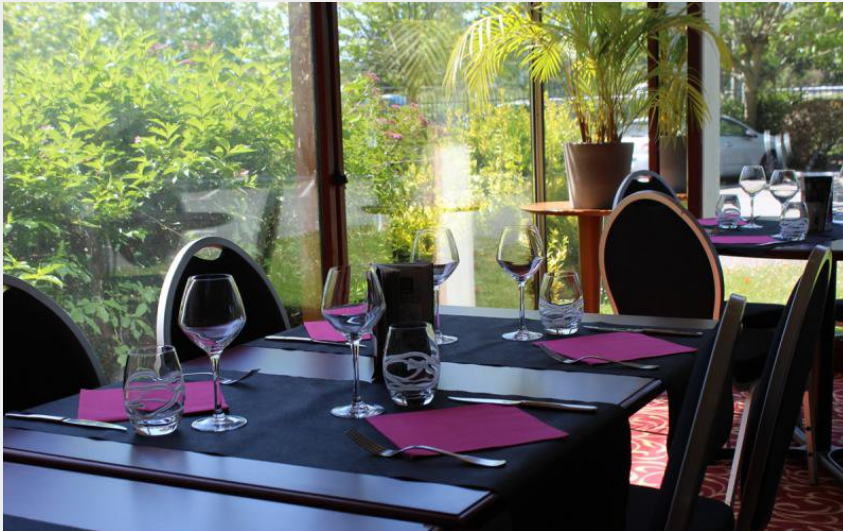
Vigneux-restaurant2brit hotel-interieur